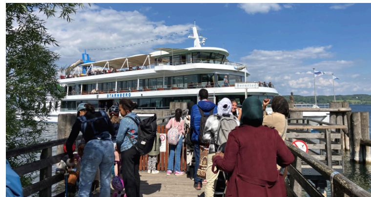
Ausflug zum Starnberger See

Im Februar besuchten wir zum ersten Mal die Schmetterlingsausstellung im Botanischen Garten. Der Ausflug war in einem Tag ausgebucht, sodass wir kurzerhand einen zweiten Zeitslot buchten. Am Ende durften wir dann doch alle gleichzeitig rein und Jung und Alt beobachteten begeistert die bunten Schmetterlinge aus nächster Nähe. Die verschiedenen Zyklen wie Eiablage, Verpuppung und Raupen faszinierten genauso wie die Schildkröten, Kakteen und anderen tropischen Pflanzen, die die Ausstellung auch noch bot.