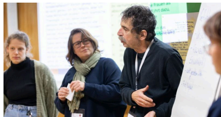
Workshop auf der Fachtagung Dessau

Die Bundeszentrale für politische Bildung hat die Preisträger*innen aller Jahrgänge des Wettbewerbs „Aktiv für Demokratie und Toleranz“ vom 14. bis 16. November 2025 zu einem Aktiv-Netzwerktreffen nach Dessau eingeladen. Wir beide durften für BiP, als Preisträgerin 2009, teilnehmen und sind mit einem Rucksack voller inspirierender Eindrücke, neuer Kontakte und Inputs heimgekommen.